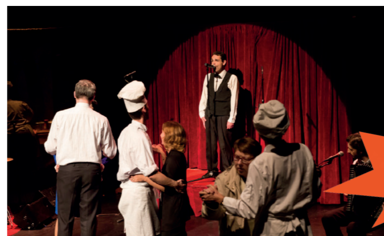
Participation du public de L'apostrophe (Cergy) à une représentation de Cabaret des frissons, Théâtre du Cristal.

> Une fois calmée et si son accompagnateur le juge opportun, la personne pourra entrer à nouveau dans la salle